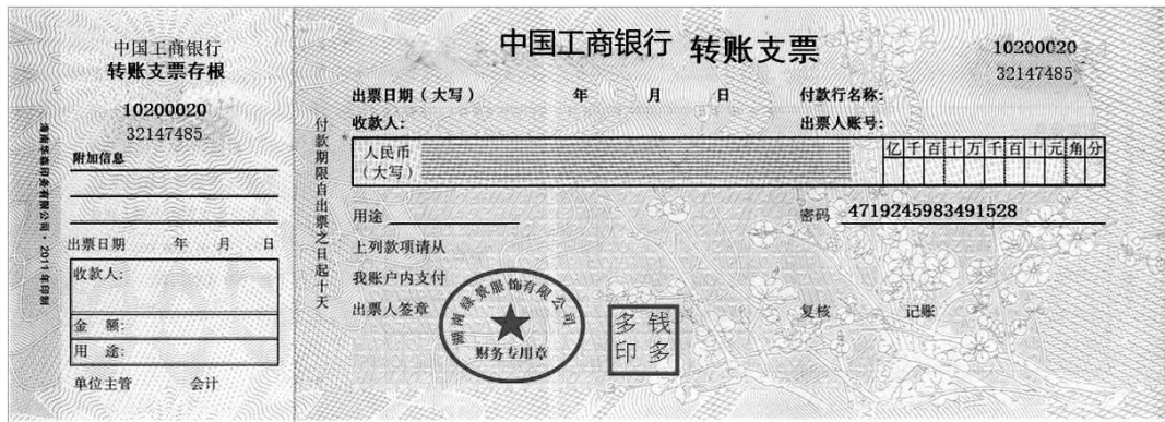
图 1-4-3 转账支票

4. 2020年6月8日,湖南绿景服饰有限公司开出转账支票一张(见图1-4-3),支付原材料货款,金额为98762.00元。