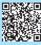
微课 什么是心理咨询

简介：这是一部立足如何解决问题，为社会热点和难点问题寻找解决路径，探索调查类的纪录片。该纪录片从科学、社会等多角度出发认识抑郁，解剖抑郁产生的原因，寻找对抗抑郁全面、可行的路径和方法。该纪录片共6集，分别为少年已知愁滋味；她们；步入老年；或许，你也有条黑狗；坚持，再坚持一下；寻找精准医学之路。