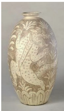
图1-9 瓷器 登封窑珍珠地划花双虎纹瓶 / 宋