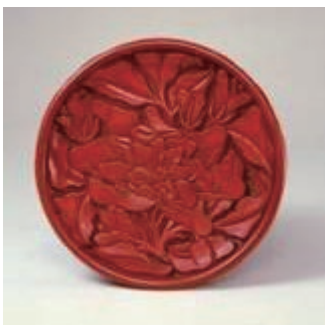
图1-8 漆雕 剔红栀子花纹圆盘 / 张成造 / 元

工艺美术的特点是实用与美观相结合,其制作受物质材料和生产技术的制约,工艺美术的门类众多,品种丰富,具有特殊的艺术魅力。