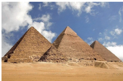
图1-11 陵墓建筑 金字塔 / 埃及

建筑是人类为自己创造的物质生活环境，是人类生活必需的居住和活动的场所，也是为满足人们生活、生产或从事其他活动而创造的空间环境，它是基于实用的目的而建造的。建筑艺术按照美的规律，运用建筑艺术独特的艺术语言而创造，建筑形象具有文化价值和审美价值，具有象征性和形式美，体现出民族性和时代感。按功能性特点的不同，建筑艺术可分为纪念性建筑、宫殿陵墓建筑（图1-11）、住宅建筑（图1-12）、宗教建筑（图1-13）、园林建筑、生产建筑等类型。从总体来说，建筑艺术与工艺美术一样，也是一种实用性与审美性相结合的艺术，随着人类实践的发展和科学技术的进步，建筑越来越具有审美价值。