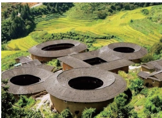
图1-12 住宅建筑 漳州土楼