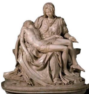
图1-5 圆雕 悲痛的圣母 / 米开朗基罗·博那罗蒂 / 意大利

(3) 透雕(图1-7)。透雕也称为凹雕、镂空雕,是在浮雕的基础上镂空其背景部分,有单面雕和双面雕两种。