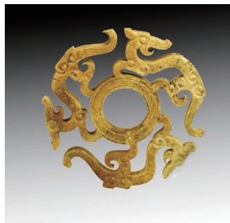
图1-7 透雕 三龙环形玉饰 / 战国