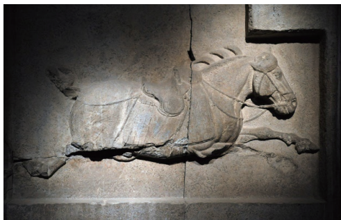
图1-6 浮雕 昭陵六骏之青骢 / 阎立德 / 唐