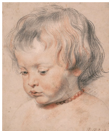
图1-4 素描 儿童肖像/彼得·保罗·鲁本斯/佛兰德斯