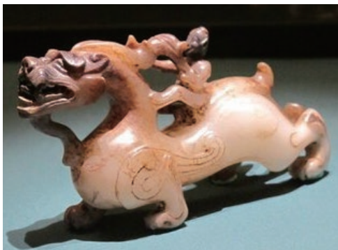
图1-10 玉雕 羽人骑神兽 / 西汉