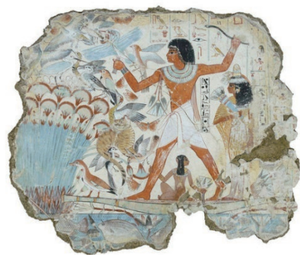
图1-3 壁画 内巴蒙在湿地里狩猎/埃及