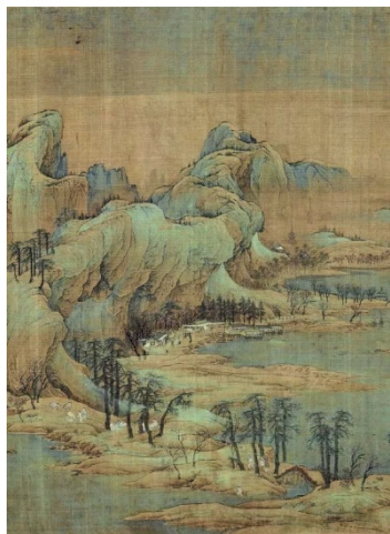
图1-1 中国画 江山秋色图/赵伯驹/宋