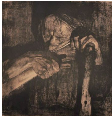
图1-2 版画 磨镰刀/凯绥·珂勒惠支/德国